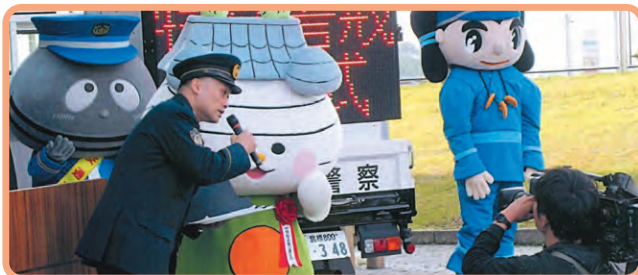
一日警察署長 おまっちゃん