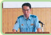
松江警察署長あいさつ