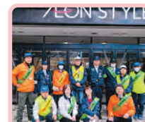
白湯・朝日・雑賀