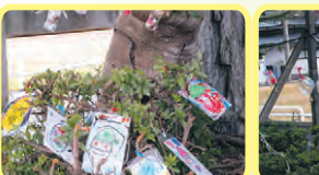
オーナメント飾り